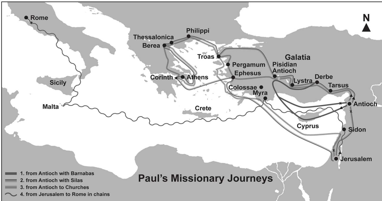
Paweł, sługa Jezusa Chrystusa, powołany Apostoł, odłączony ku opowiadaniu Ewangelii Bożej; - Rzymian 1:1