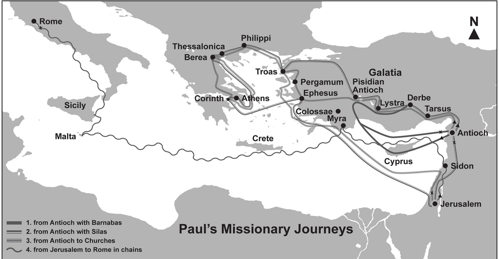
Nze Pawulo, omuddu wa Yesu Kristo, Mukama waffe Kristo, nayitibwa okuba omutume, eyayawulibwa okubuulira Enjiri ya Katonda, - Abaruumi 1:1