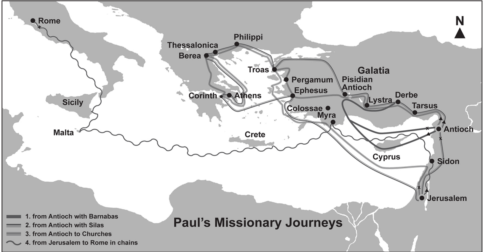
Παῦλος, δούλος Ἰησοῦ Χριστοῦ, κλητὸς ἀπόστολος, ἀφωρισμένος εἰς εὐαγγέλιον Θεοῦ, - Προς Ρωμαίους 1:1