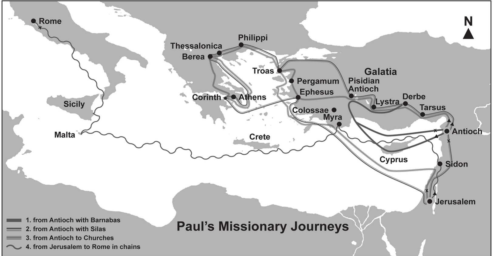
Paulus, een dienaar van Jezus Christus, geroepen tot apostel, afgezonderd tot het Evangelie van God, - Romeinen 1:1