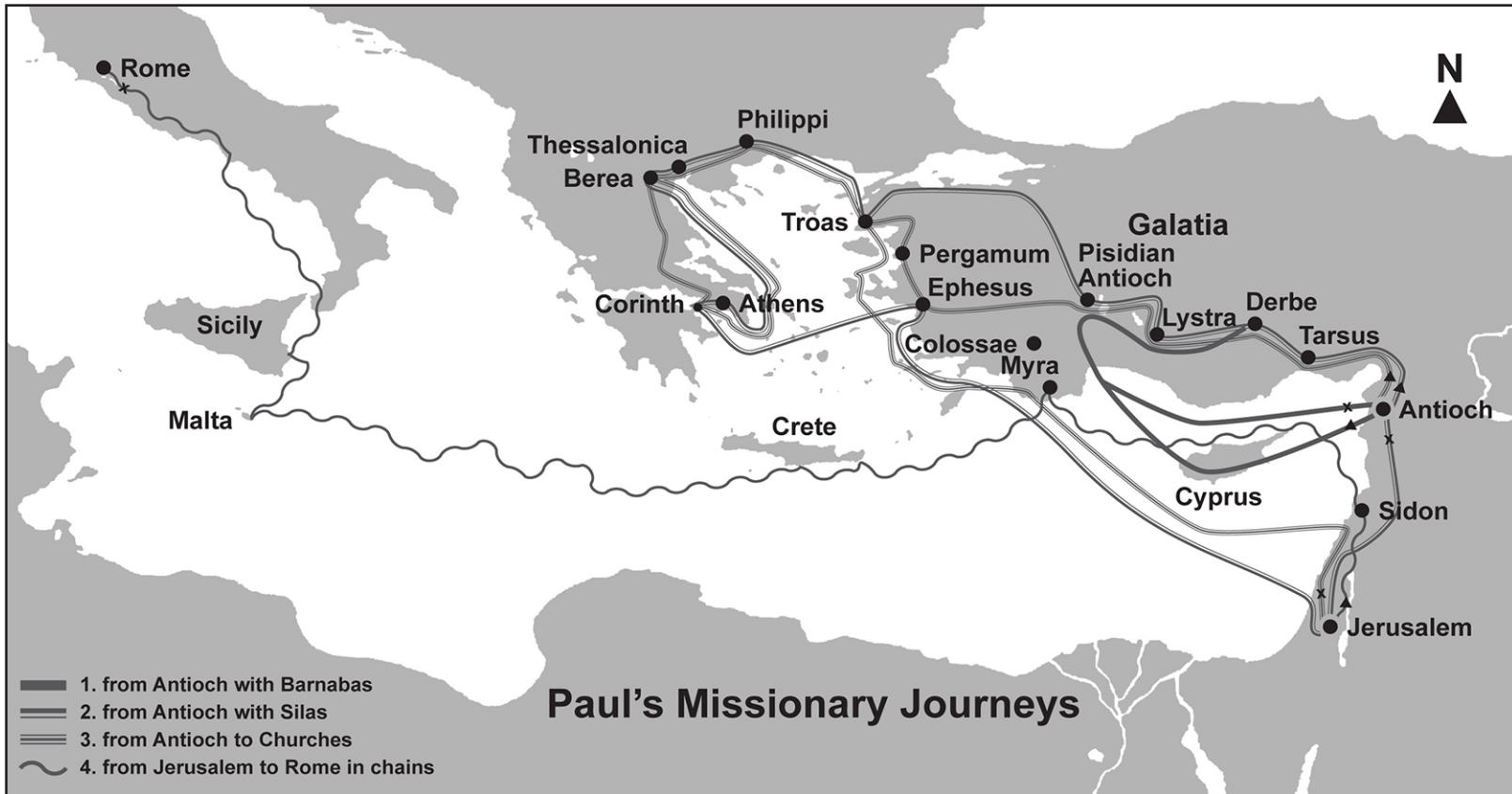
Paŭlo, servisto de Jesuo Kristo, apostolo vokita, apartigita al la evangelio de Dio, - Romanoj 1:1